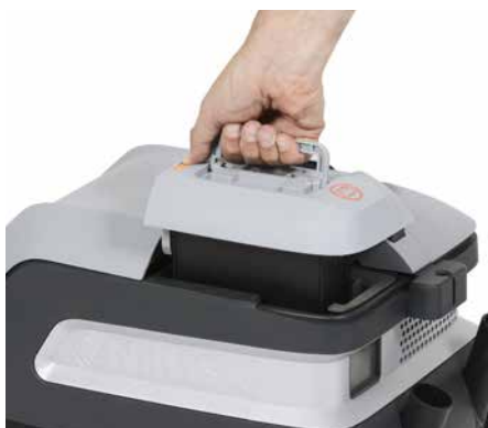
Leicht zugängliche Batterie macht das Aufladen schnell und einfach