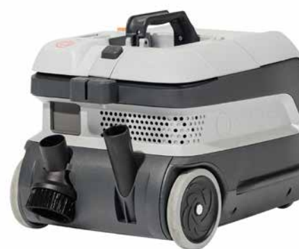
Benutzerfreundliches und leicht erreichbares Zubehör