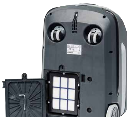
HEPA H13-Abluftfilter ist Standard bei allen Varianten des VP600 Battery