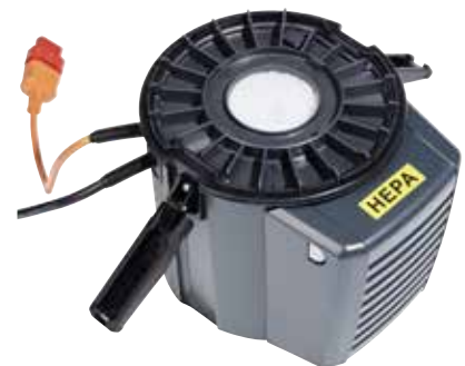
Ein einfach austauschbarer HEPA-Abluftfilter ist Standard.