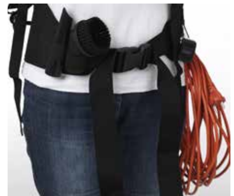
Die Zubehörteile sind griffbereit am Gürtel.