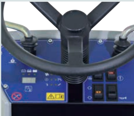
Die SW4000 spart Energie und Material durch automatisch anhaltende Besen im Stillstand.