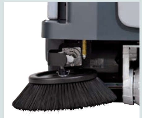
DustGuard™-System (optional) für weniger Staubaufwirbelung beim Kehren.