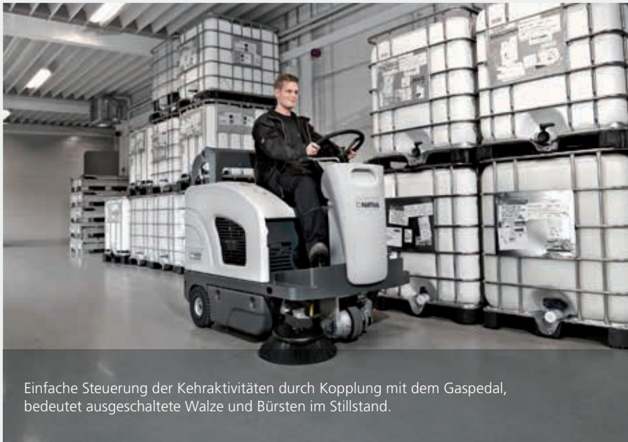
Einfache Steuerung der Kehraktivitäten durch Kopplung mit dem Gaspedal, bedeutet ausgeschaltete Walze und Bürsten im Stillstand.