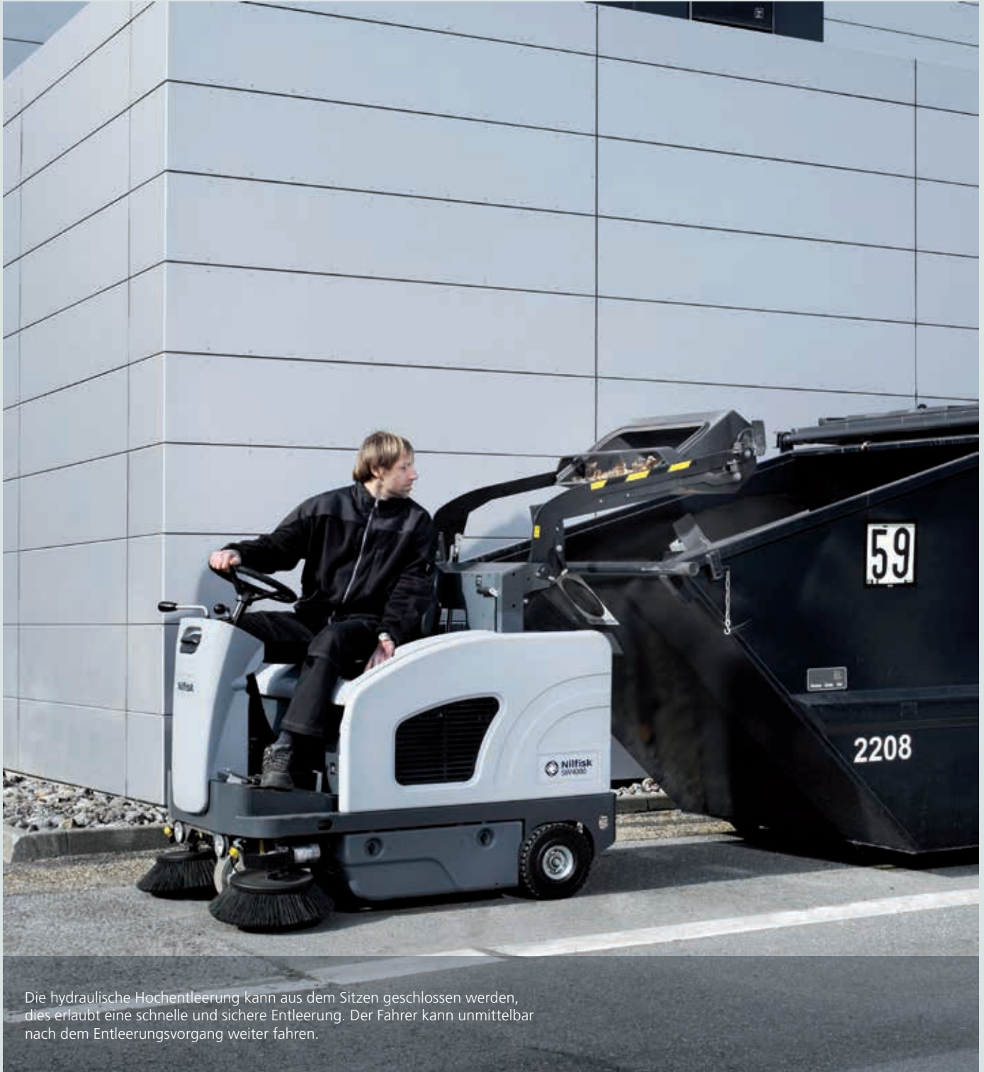
Die hydraulische Hochentleerung kann aus dem Sitzen geschlossen werden, dies erlaubt eine schnelle und sichere Entleerung. Der Fahrer kann unmittelbar nach dem Entleerungsvorgang weiter fahren.